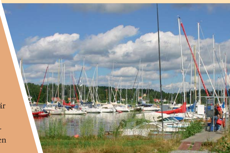
Småbåtshamn, TBK Åkersberga säkert förankrad med Moorsafe ankare.

Vi har valt att inte samarbeta med någon av de stora etablerade ankartillverkarna. Vi har därför börjat med mindre förankringsprojekt för att skaffa mer praktisk erfarenhet av att hantera och installera Moorsafe ankare. Vi har de senaste åren installerat över 150 Moorsafe ankare med mycket gott resultat som även överträffat våra högt ställda förväntningar.